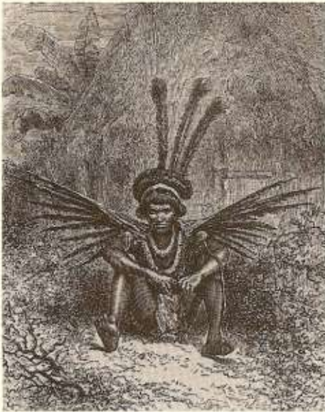
'Een pyjai; Dr. M. Jules Crévaux noemde hem 'mijn collega'

Bij het thema van dit nummer stond ik stil bij de vraag, op welke manier beleeft de inheemse mens spiritualiteit? Mijn gedachtes gingen uit naar het bestaan van de medicijnman bij inheemse gemeenschappen. Mijn moeder vertelde mij het verhaal, dat mijn overgroot-opa nog een grote pan voor kruiden bezat en daarnaast een 'godo' of 'marakha' gebruikte waarmee hij zijn werk als medicijnman uitvoerde. Toen zijn marakha werd vernield, is mijn overgroot-opa dat niet meer te boven gekomen. Dit toont wel aan, hoe belangrijk dit werktuig was voor hem. Maar wat is een medicijnman eigenlijk? Wat houdt zijn werk in? En bestaat deze specialist nog tegenwoordig? Om deze vragen te kunnen beantwoorden, begon ik weer in mijn archief te zoeken naar informatie. Hierna volgen bewerkingen uit belangrijke bronnen, met historische gegevens over de medicijnman of in Suriname beter bekend als de pyjai.