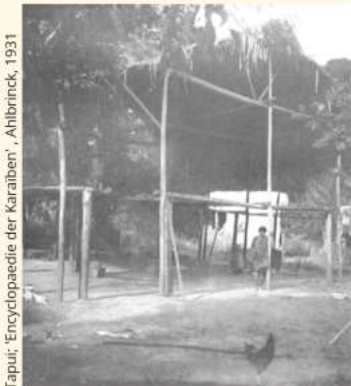
Tapui; 'Encyclopaedie der Karaïben', Ahlbrinck, 1931

De opleiding van de 60 jongeren op Galibi begint allereerst met het aanleggen van een veld voor tabaksteelt. Er wordt een tapui, met bladeren bedekt leerhuis, voor de leerlingen opgezet. De jongeren leren ook een marakha te maken. De marakha is het belangrijkste instrument van de pyjai. Ook moeten zij leren hoe een kaimanbankje te snijden uit een houtstronk. Het bankje is noodzakelijk voor het pyjaiwerk. De leerlingen maken een putaya-kooi, manshoogte, met latten en boven een opening want het is de bedoeling dat de leerling hierin plaatsneemt. De kooi wordt alvast gemaakt voor de tweede leernacht.